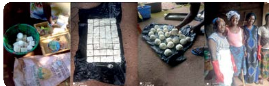
Production de savon domestique; quelques photos récentes.